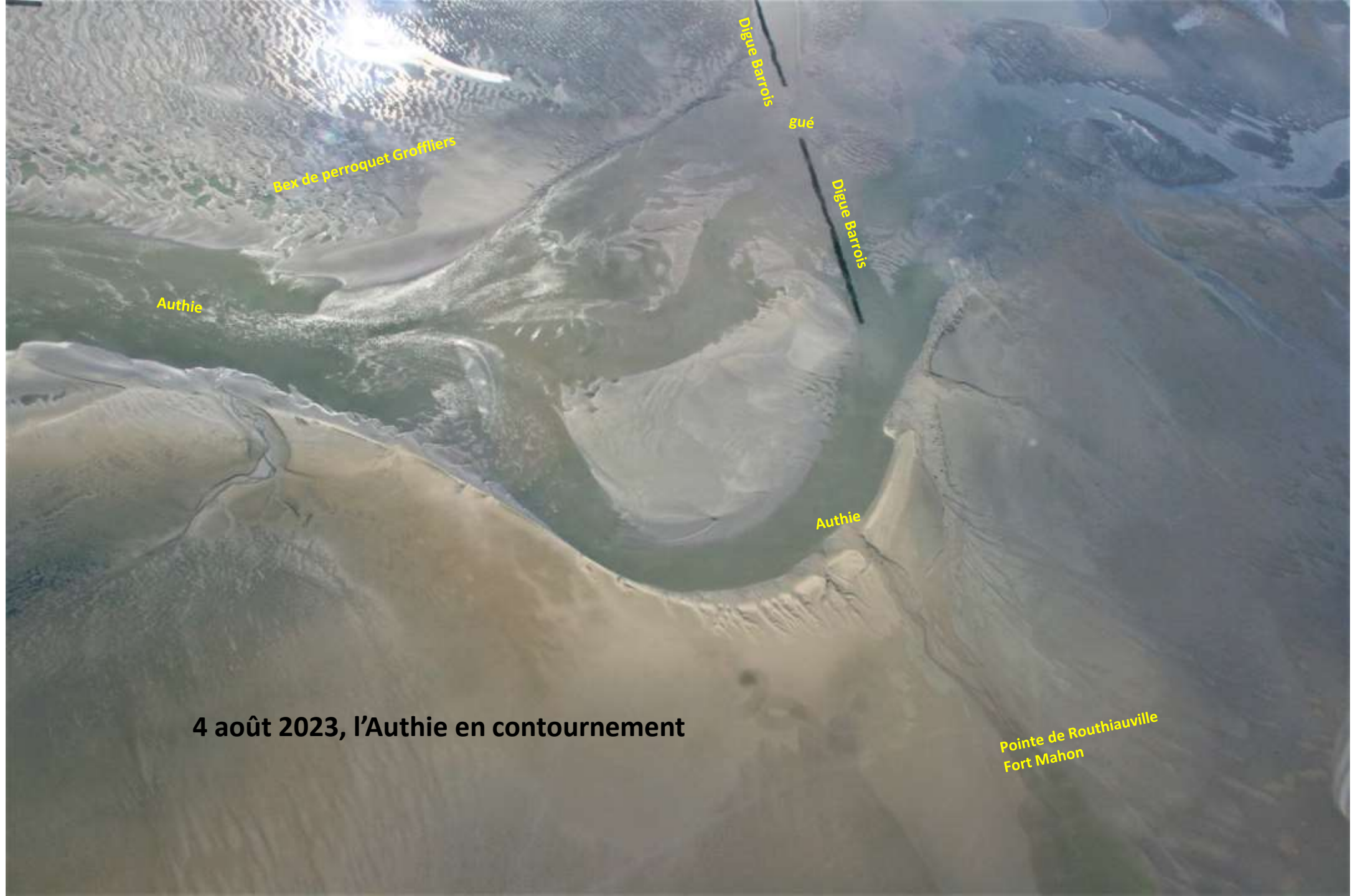
4 août 2023, l'Authie en contournement